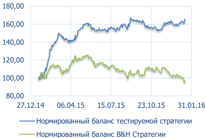
ПРИМЕР ПРОФИЛЯ ФУНКЦИИ КАПИТАЛА ТОРГОВОГО РОБОТА В СРАВНЕНИЕ СО СТРАТЕГИЕЙ V&N